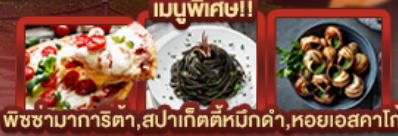
พิซซ่ามาริตตา, สเปาเก็ตตีหมักดำ, หอยแอสคาโก