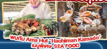
พบกับ Ama Hut "Haohiman Kamado" เมนูพิเศษ SEA FOOD

สายการบิน AirAsia X (XJ) น้ำหนักกระเป๋า 20 KG