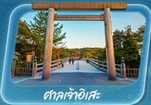
ศาลเจ้าอิเสะ

ทัวร์ญี่ปุ่นสุดฟิน เยือนหมู่บ้านมรดกโลกชิราคาวาโกะ ชมธรรมชาติสุดอลังคามิโคจิ เช็กอินแลนด์มาร์คคัง ปราสาทโอซาก้า ขอพรที่วัดน้ำใสคิโยมิสึคุระ ศาลเจ้าอิเสะ ถนนโอฮาโระมาจิ+ตลาดโอคาเกะ ปักท้ายช้อปปิ้งชินโซบาชิ ย่านชานาเกะ ถ่ายรูปสุดชิคที่ Oasis 21 หอคอยนาโกย่า TV Tower