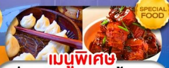
เมนูพิเศษ เสี่ยวหลงเป่า หมูน้ำแดง เดินทาง ต.ค. 69 - มี.ค. 70