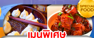
เมนูพิเศษ เสี่ยวหลงเปา หมูน้ำแดง เดินทาง ต.ค. 69 - มี.ค. 70