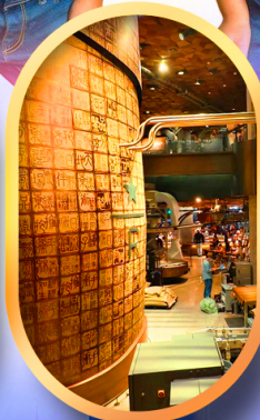
ร้านสตาร์บัคส์