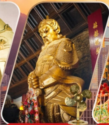
CHE KUNG (SHA TIN)