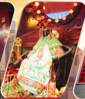
KWAN YUM HH