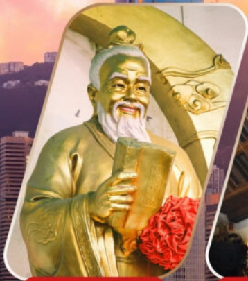
WONG TAI SIN