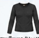
สวมฮีทเทค (Heattech) แบบหนาพิเศษด้านใน