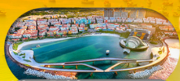
Kiss Bridge สะพานจูบ รวมค่าเข้าสะพานจูบแล้ว