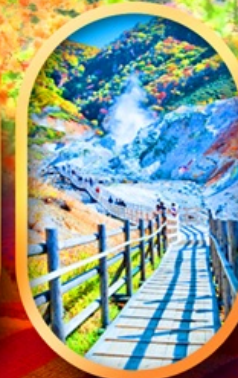
หุบเขานรกจิดอกุคาบิ