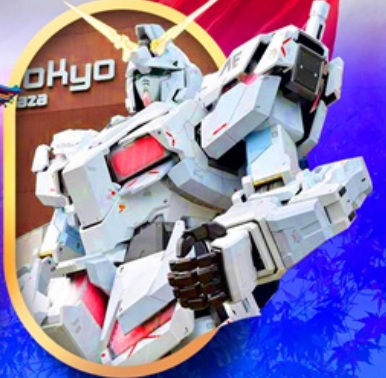
ห้างไอโดะบะกันดัม