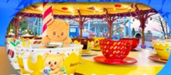
Fuji q Highland x Butterbear เดินทาง พ.ค. 69 เป็นต้นไป