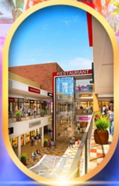
มิตซุชิเอะกัอิเค็ต