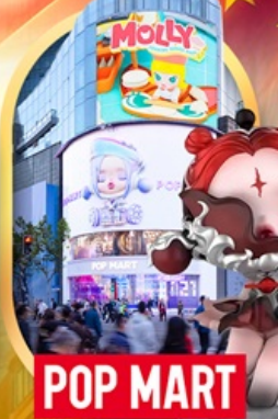
ช้อปปิ้งร้าน Pop Mart