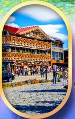
ภูเขาไฟฟูจิ ชั้น 5