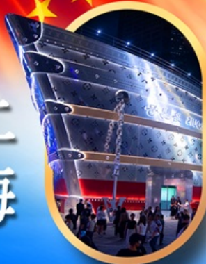
เรือคอะหลุยส์