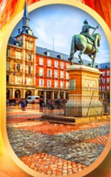
พลาซามายอร์