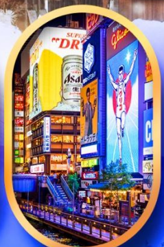
ย่านชินโซบาชิ