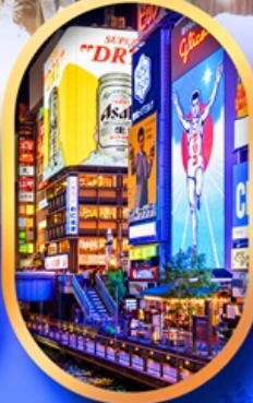
ย่านชินโซบาชิ