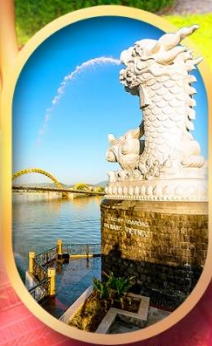
คาร์พดราท็อน