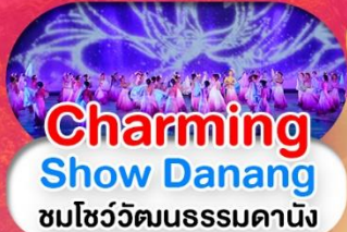
Charming Show Danang ชมโชว์วัฒนธรรมดานัง