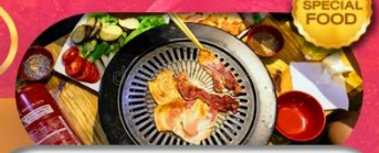
พิเศษเมนู BBQ Buffet เดินทาง มี.ค. - ต.ค. 69