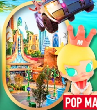
เลือกซื้อทัวร์เสริม เซี่ยงไฮ้ ดิสนีย์แลนด์