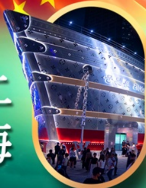
เรืออะทลันติก