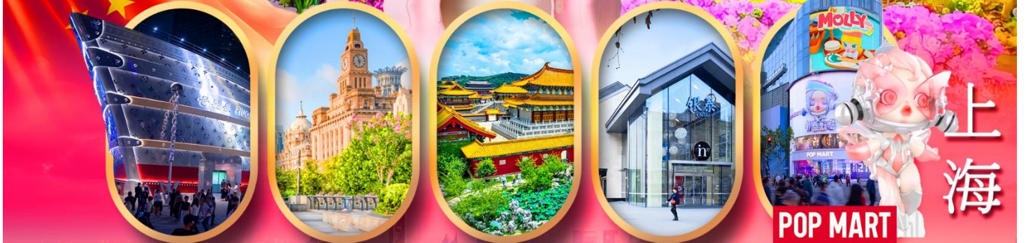
เรืออะทลุลย์