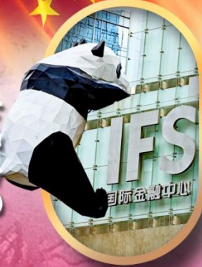
IFS หนีแพนด้าป็นตึก