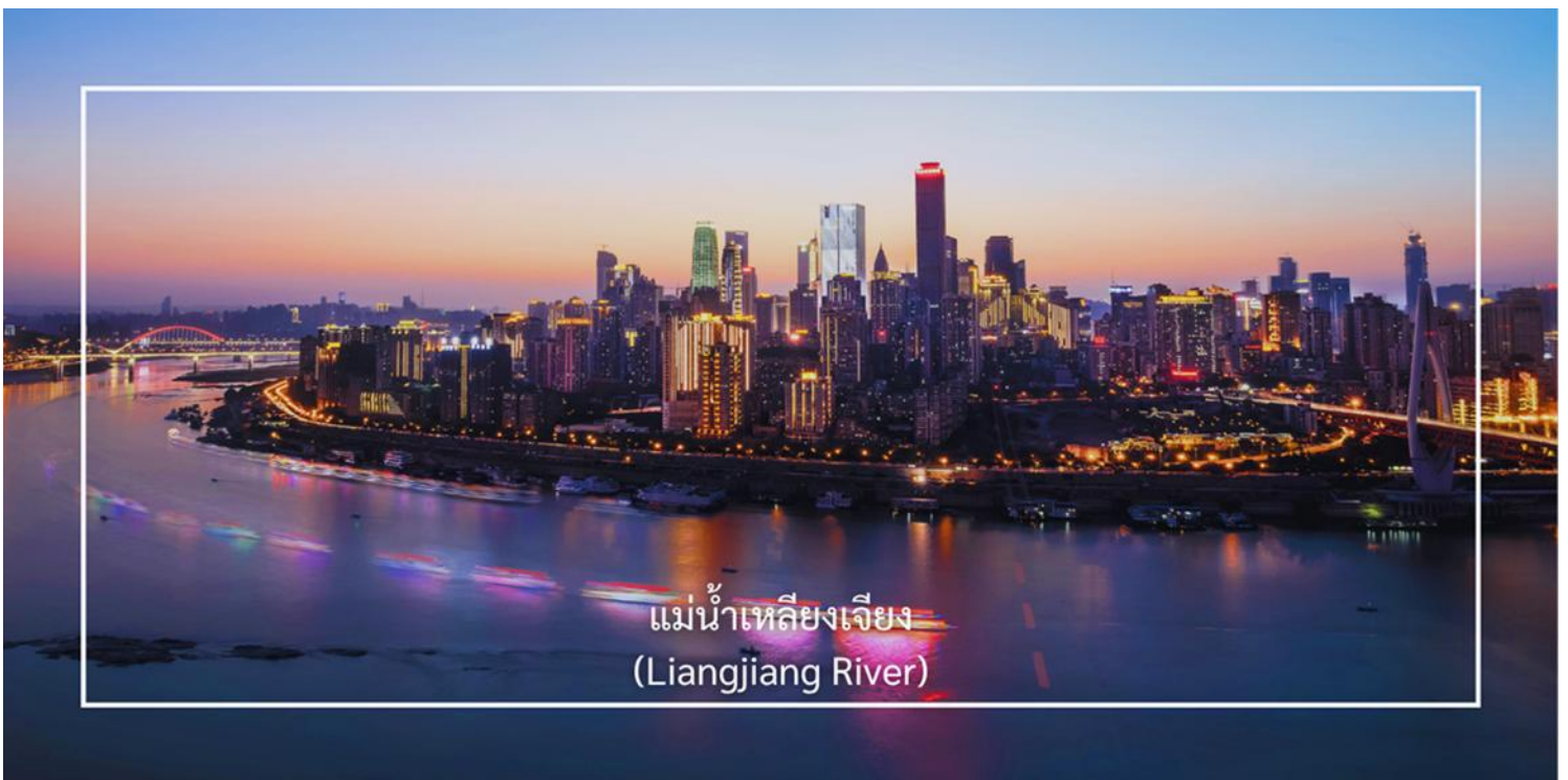
แม่น้ำเหลียงเจียง (Liangjiang River)

ล่องเรือแม่น้ำเหลียงเจียง (Liangjiang Cruise) พื้นที่จุดบรรจบของแม่น้ำทั้งสอง ซึ่งเป็นหนึ่งในมุมมองที่สวยงามที่สุดของเมืองฉงชิ่ง ซึ่งประกอบด้วย แม่น้ำแยงซี (Yangtze River) เป็นแม่น้ำสายที่ยาวที่สุดในจีน และเป็นสายหลัก แม่น้ำเจียงหลิง (Jialing River) แม่น้ำสาขาที่สำคัญซึ่งไหลลงสู่มแม่น้ำแยงซี พื้นที่ที่แม่น้ำทั้งสองสายนี้มาบรรจบกันมีชื่อว่า “เหลียงเจียง” กิจกรรมล่องเรือสองแม่น้ำ (Two Rivers Cruise) ซึ่งได้รับความนิยม เพราะจะได้ชมเส้นขอบฟ้าของฉงชิ่งยามค่ำคืน ตึกระฟ้า แสงไฟเมือง เป็นเอกลักษณ์