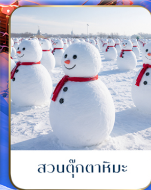
สวนตุ๊กตาหิมะ