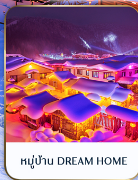
หมู่บ้าน DREAM HOME