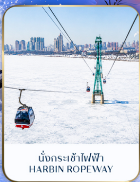
นั่งกระเช้าไฟฟ้า HARBIN ROPEWAY

ธันวาคม - มกราคม 2570 เริ่มต้น 44,989 บาท