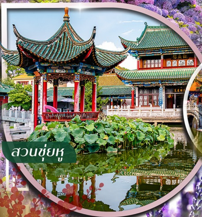
สวนชู่ฮู่