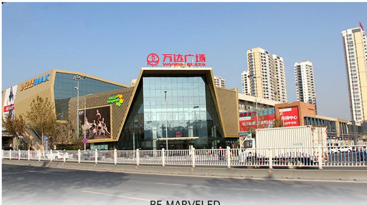
BE MARVELED ช้อปปังศูนย์การค้า (Qingdao Wanda Plaza)

ที่พัก HOLIDAY INN EXPRESS QINDAO หรือเทียบเท่าระดับ 4 ดาว