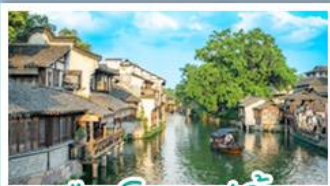
เมืองโบราณอู๋เจิน