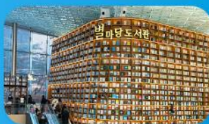
ห้องสมุดสตาร์ฟิลา