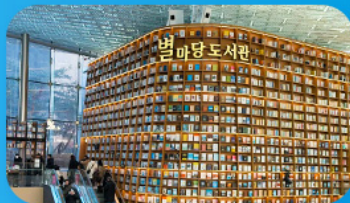
ห้องสมุดสตาร์ฟิลา

เก็บทุกไฮไลท์ ในกรุงโซล ตั้งแต่ความงดงามของ พระราชวังเคียงบ็อก ชมวิวสุดอลังการที่ ตึกลิอิตเต้ โซลสกาย (รวมค่าลิฟต์ขึ้นตึก) สนุกสุดมันส์ที่ สวนสนุกลิอิตเต้ เวิร์ล (รวมค่าบัตรเครื่องเล่น) เพลิดเพลินไปกับโลกใต้ทะเล ล้อตเต้ อควาเรียม (รวมค่าบัตรเข้าชม) เช็กอินแลนด์มาร์กสุดฮิตอย่างห้องสมุดสตาร์ฟิลา โคเอกมอลล์ เดินเล่นย่านฮิป บรูกลินเกาหลี ชองชุง และช้อปปิ้งซัมเมอร์เซล สุดฟิน ย่านเมืองคงและงแทค