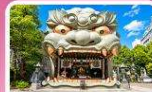
ศาลเจ้านิมมะ ยาชากะ