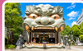
ศาลเจ้านัมบะ ยาชากะ