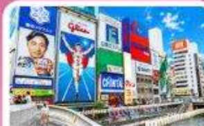
ชินโซนาชิ