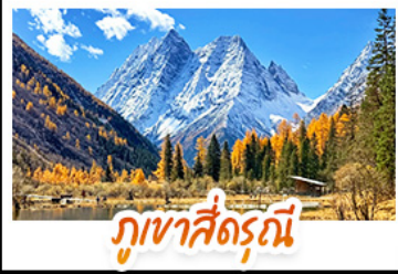
ภูเขาสัตรีณี

ชมทะเลสาบสีฟ้ามรกต ณ จิวจ้ายโกว • เช็กอิน "ภูเขาสัตรีณี" สัมผัสความงดงามของใบไม้เปลี่ยนสี ชมทิวทัศน์ภูเขาหิมะติดกับผืนป่าสีทอง • ชมแอ่งน้ำสีฟ้ามรกตสุดมหัศจรรย์ ณ อุทยานหวงหลง • ช้อปปิ้งใจ ถนนไท่กุ่หฺสึ และถนนคนเดินซุนชิวพิเศษ! นั่งรถไฟความเร็วสูง 1 ไร่ สู่เมืองอิงคุ