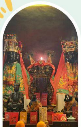
วัดหมิ่นโหมว