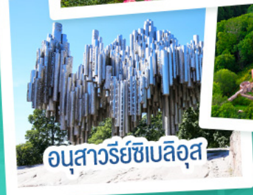
อนุสาวรีย์ซีเบลึส