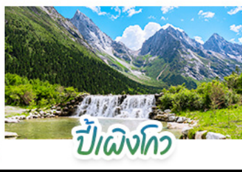
ปีติงโกว