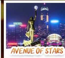
AVENUE OF STARS