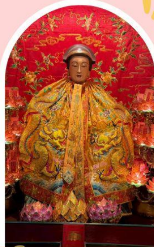
วัดหลงโหมว ความสำเร็จ ความมั่งคั่ง เงินทองไหลมาเทมา