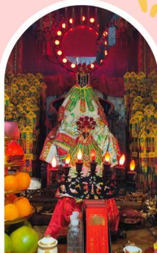
วัดเจ้าแม่กวนอิมฮ่องฮำ ขอพรเรื่องเงิน ทรัพย์สิน และความมั่งคั่ง