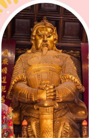
วัดเชกวง ขอพรโชคลาภ การเงิน และธุรกิจ