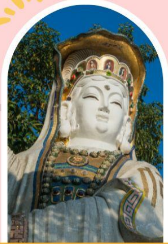
รีพลัสเบย์ รับพลังงานดี เสริมพลังดวงจ้อย