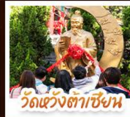
วัดเซ่งโงมว