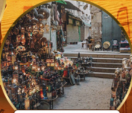
ตลาดบ้านเอลคาลิลี