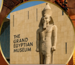
พีพีรภัณฑ์แกรนด์อียิปต์