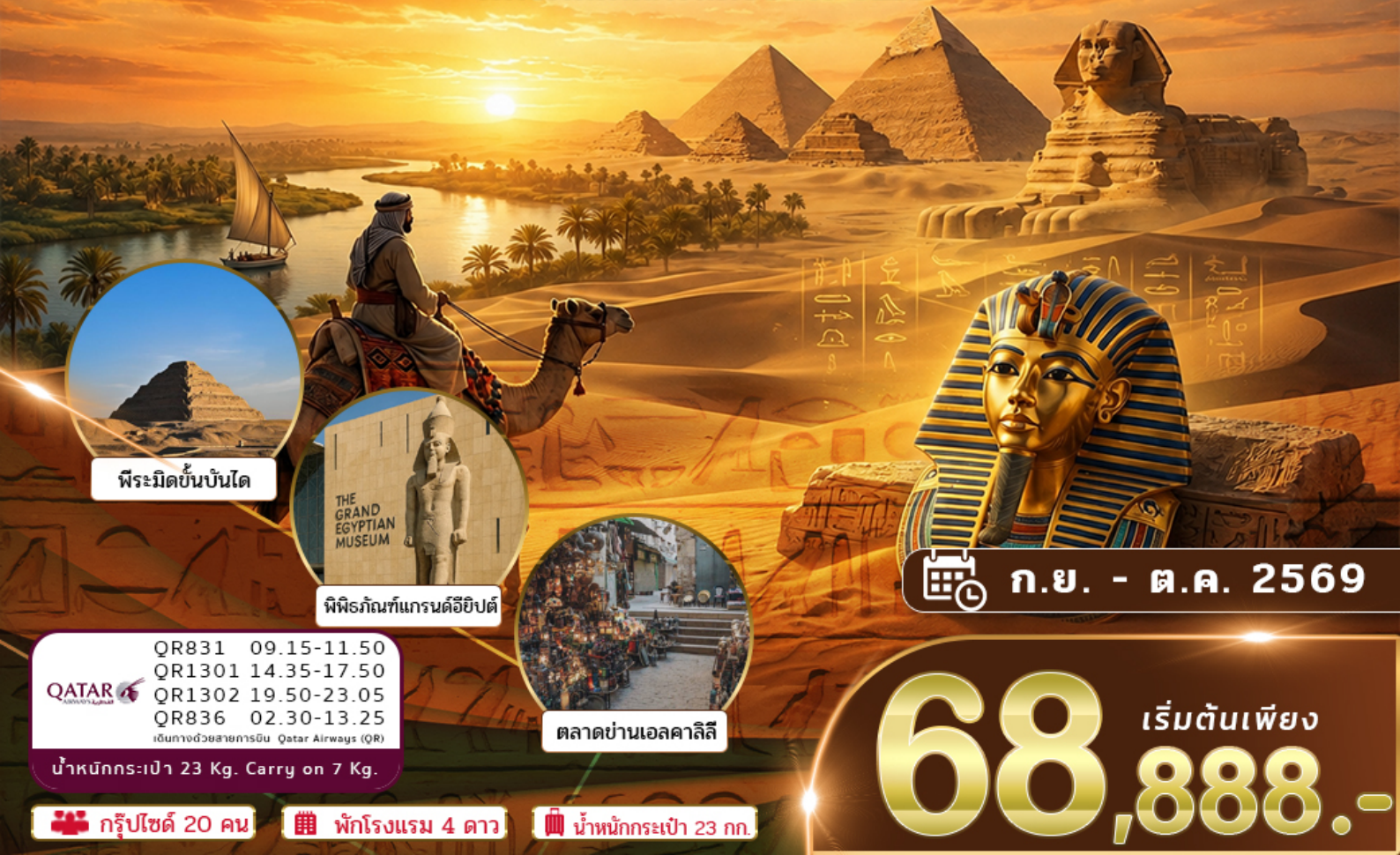
พีระมิดขั้นบันได

โคโร กัสซา เมมฟิส อเล็กซานเดรีย พีพีรภัณฑ์แกรนด์อียิปต์ GEM