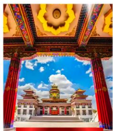
วัดโพธิ์สัตว์