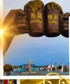
วาฟเดี่ยวดาย