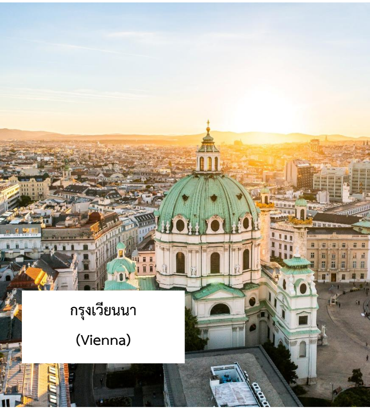
กรุงเวียนนา (Vienna)

เมนูพิเศษ!!! กุลาซซูป อาหารประจำชาติฮังการี