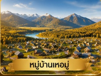
หมู่บ้านเหมย

อุหลุมูจี • ธารน้ำห้ำสี • แกรนด์แคนยอนขุยถุน • หมู่บ้านเหมย