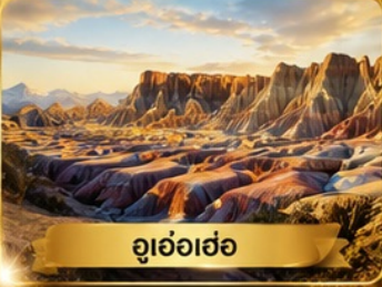
อุ่อฮ้อฮ่อ