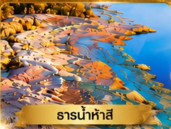
ธารน้ำห้ำสี