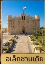
อเล็กซานเดีย