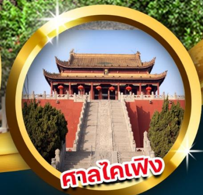
ศาลไคเฟิง

สัมผัสความยิ่งใหญ่ของ "กองทัพจีนซีฮ่องเต้" ชม 'ถ้ำหลงเหมิน' มรดกโลกสุดยิ่งใหญ่แห่งลั่วหยาง เจดีย์ห้าชั้นปาใหญ่ ตำนานพระถังซำจั๋ง ช้อปปิ้งตลาดมุสลิม