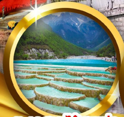
ทะเลสาบไ้สวยเห่อ