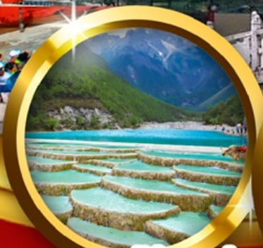
ทะเลสาบไ้สยเห่อ