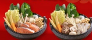
สุกั้ปลาแซลมอน+สุกั้เห็ด