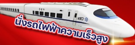
ขั้รถไฟความเร็วสูง