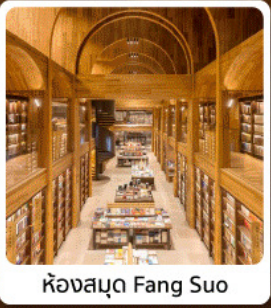
ห้องสมุด Fang Suo

ไฮไลท์! ตะลุยสุสานทหารดินเผาจินซี ชมเจดีย์ห่านป่าใหญ่ แลนด์มาร์กช้อปปิ้ง เดินเล่นเมืองโบราณยามค่ำ ช้อป POP Mart & ห้างอู๋เย่ ฟินคนทุกฟีล