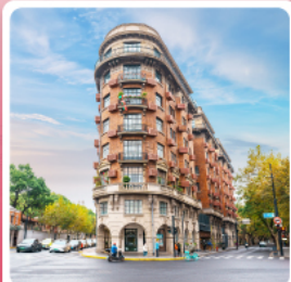
ถนนอู๋คัง