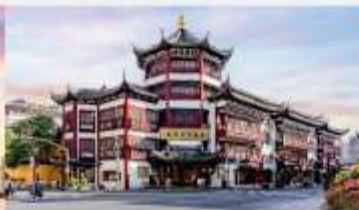
ตลาดร้อยปีเงินหวงเมี่ยว