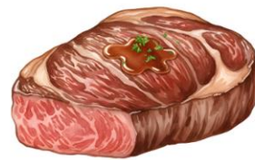
● ไม่ทานเนื้อหมู