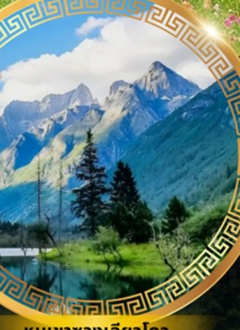
หุบเขาวงเฉียวโกว