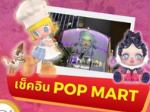
เช็คอิน POP MART

พักโรงแรม 4 ดาว ★★★★★ ฟรี ประกันอุบัติเหตุ บริการอาหารท้องถิ่น