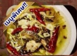
ปลาต้มพริกทอด