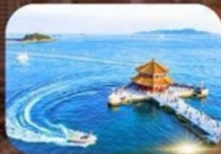
สะพานฉันเจียว