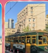
ขั้วรถรางไฟฟ้าชมเมือง