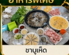
ชาบูเห็ด