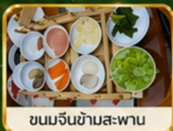
ขนมจีนซำสะพาน