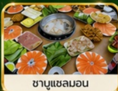
ชาบูแชลมอน