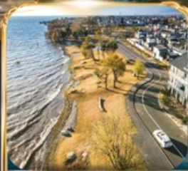
ทะเลสาบเอ่อไห่ โค้งตัว S