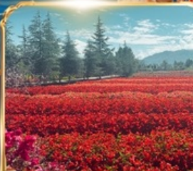
สวนดอกไม้ HUA YU MU CHANG