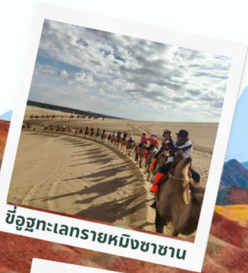
ขี่อูฐทะเลทรายหมิงซาซาน