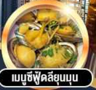
เมามูซีฟู้ดลึยมูนูน