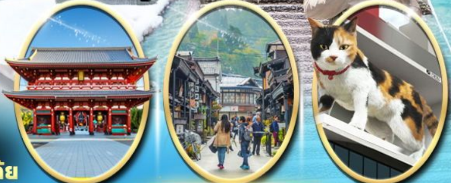
วัด เซ็นโซจิ เมืองเก่า ทาคายามา ซุปบิง ชินจุกุ