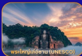
พระใหญ่เล่อซาน (UNESCO)

ล่องเรือชม "พระใหญ่เล่อซาน" - เมืองโบราณหวงหลงซี - แพนด้าเซลฟี่ - ห้องสมุดจงซูเก้อ - Wangjianglou Park - ถนนชุนซีลู่ (แหล่งซ้อปบิ่ง) - IFS (แพนด้าปิ่นตึก) - วัดต้าซือ