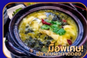
มีอพิเศษ! ปลาต้มผักกาดดอง