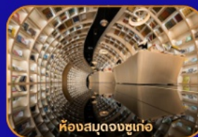
ห้องสมุดจงซูเก้อ